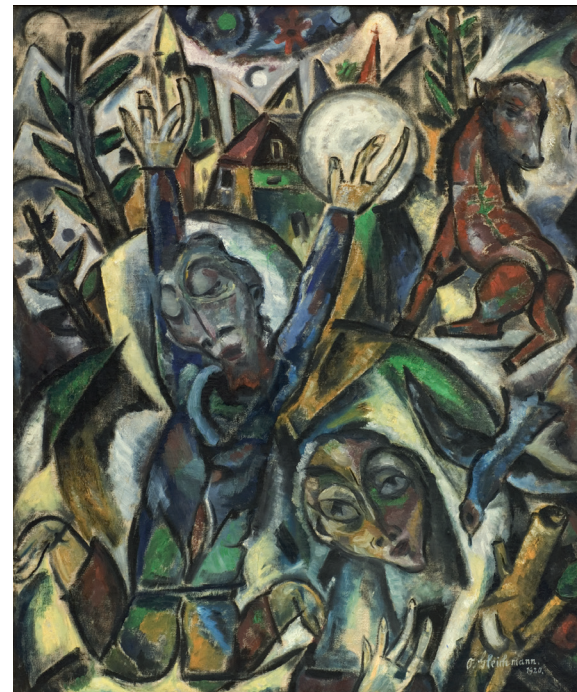
Otto Gleichmann Strahlen-Stürzen, 1920, Öl auf Leinwand, Kunstbesitz der Landeshauptstadt Hannover © Nachlass des Künstlers